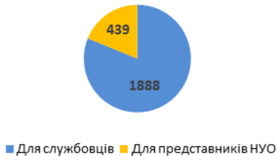
Діаграма 1. Розподіл консультацій за типом, кількість наданих радниками консультацій

Найбільше консультацій стосувалося питань призначення пенсій (604 звернення) та соціальних виплат (433 звернення) (див. Діаграму 2).