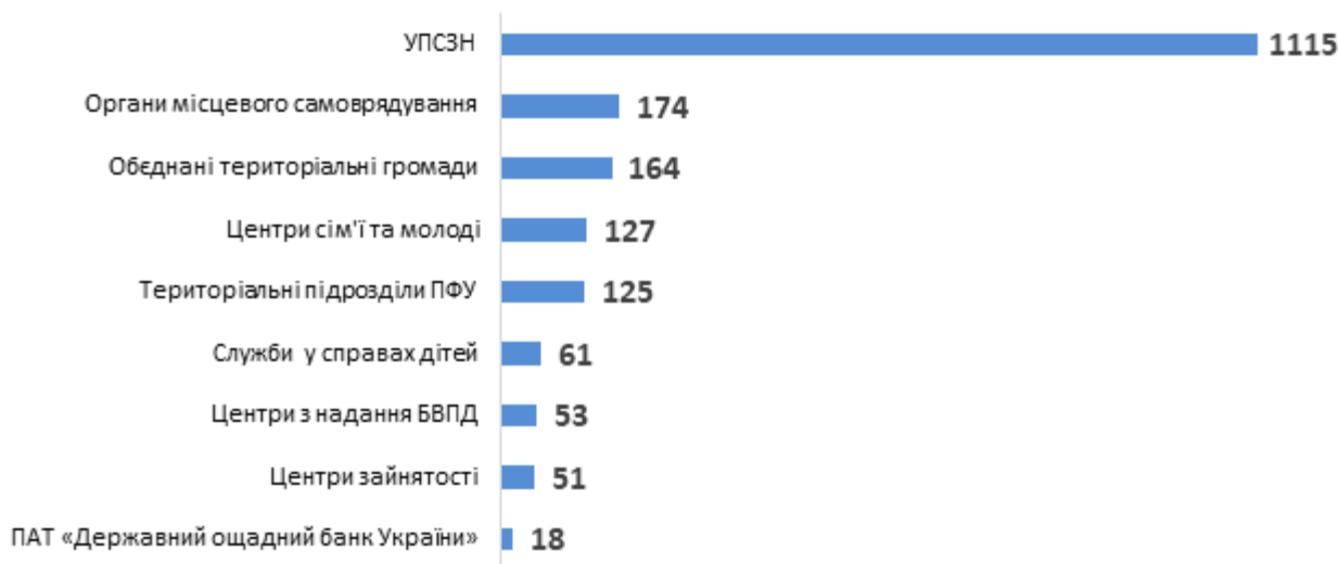
Діаграма 3. Розподіл консультацій для службовців за типами, кількість наданих радниками консультацій для службовців

Також у вересні радниками надавалися прямі консультації для 827 ВПО. Серед них більшість консультацій було надано жінкам (див. Діаграму 4).