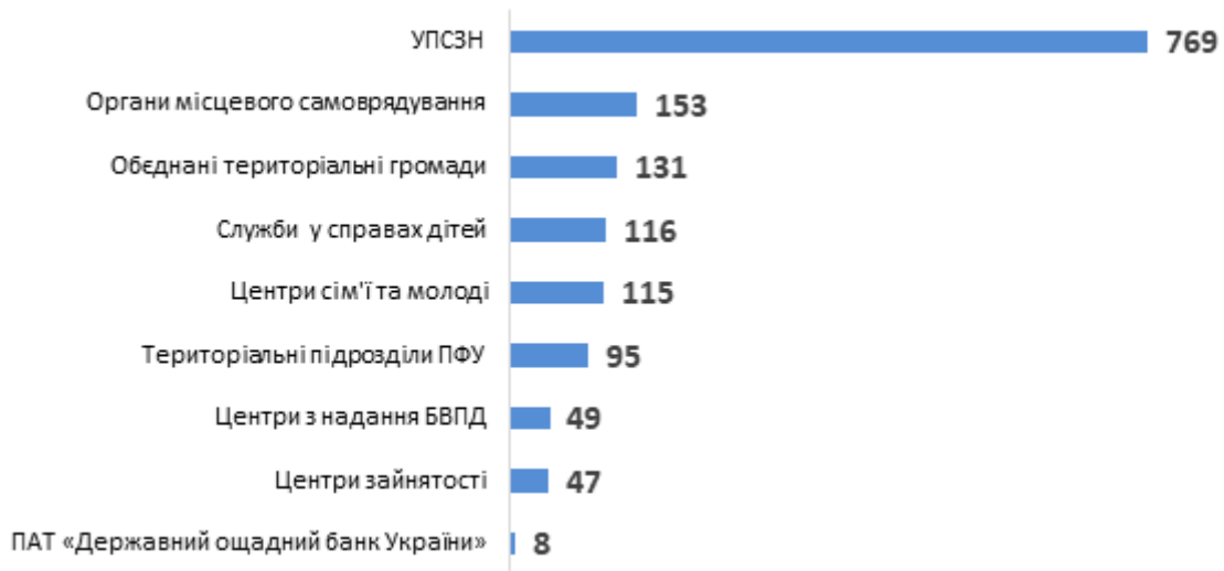
Діаграма 3. Розподіл консультацій для службовців за типами, кількість наданих радниками консультацій для службовців

Також у жовтні радниками надавалися прямі консультації для 795 ВПО. Серед них більшість консультацій було надано жінкам (див. Діаграму 4).