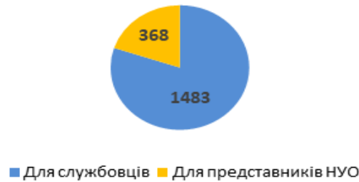
Діаграма 1. Розподіл консультацій за типом, кількість наданих радниками консультацій

Найбільше консультацій стосувалося питань призначення пенсій (447 звернень) та соціальних виплат (364 звернення) (див. Діаграму 2).