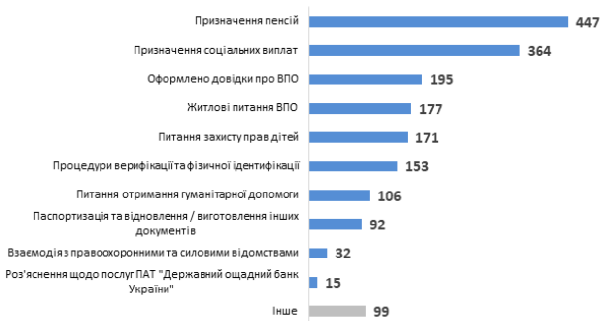
Діаграма 2. Розподіл консультацій за типами запитів, кількість наданих радниками консультацій

Серед консультацій для службовців найбільше було надано представникам УПСЗН (769 консультацій) та представникам органів місцевого самоврядування (153 консультації) (див. Діаграму 3).