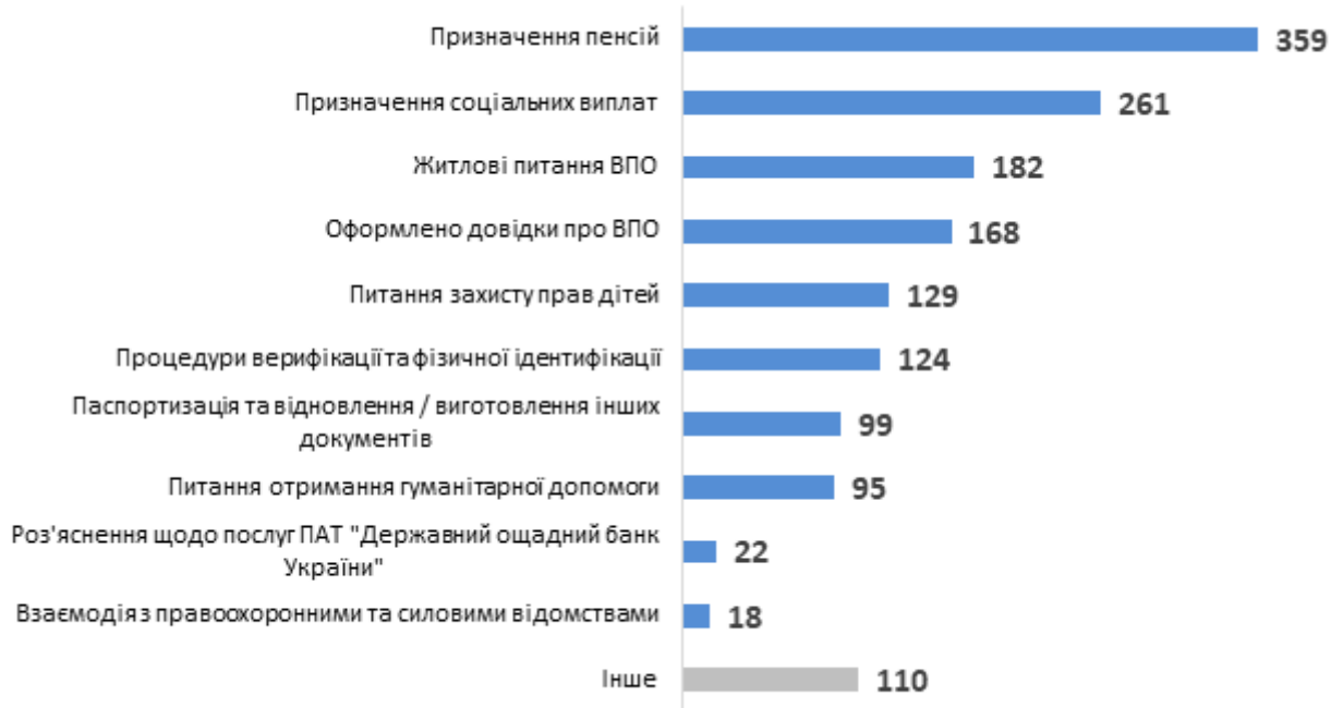
Діаграма 2. Розподіл консультацій за типами запитів, кількість наданих радниками консультацій

Серед консультацій для службовців найбільше було надано представникам УПСЗН (713 консультацій) та представникам органів місцевого самоврядування (138 консультацій) (див. Діаграму 3).