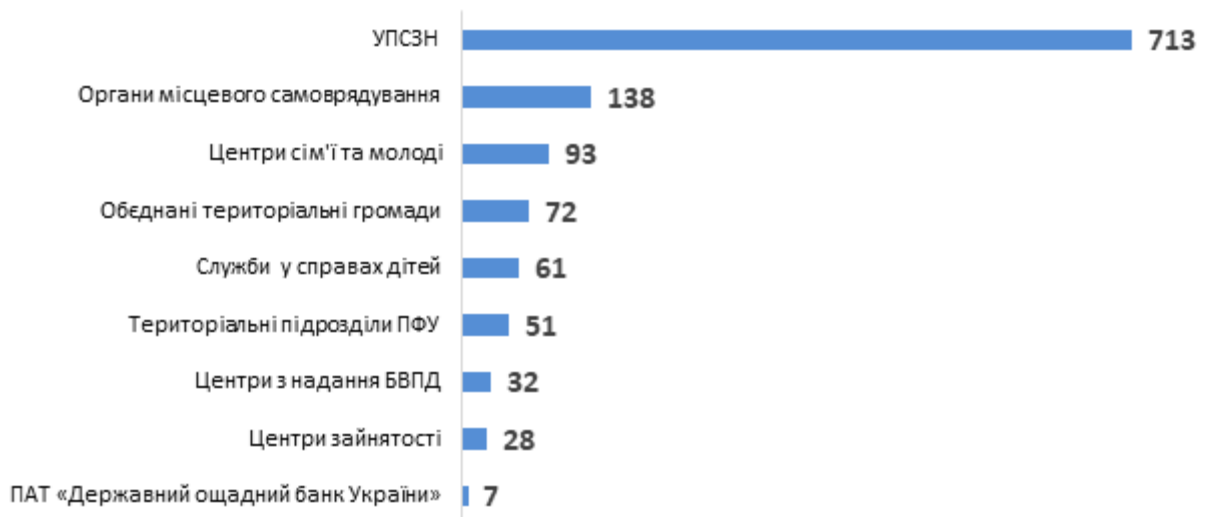
Діаграма 3. Розподіл консультацій для службовців за типами, кількість наданих радниками консультацій для службовців

Також у листопаді радниками надавалися прямі консультації для 621 ВПО. Серед них більшість консультацій було надано жінкам (див. Діаграму 4).