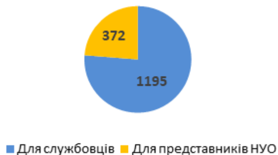
Діаграма 1. Розподіл консультацій за типом, кількість наданих радниками консультацій

У листопаді 2018 р. радниками було надано 1 567 консультацій для службовців та представників НУО. Службовцям за звітний період всього було надано 1 195 консультацій. А представникам неурядових організацій – 372 консультацій (див. Діаграму 1).