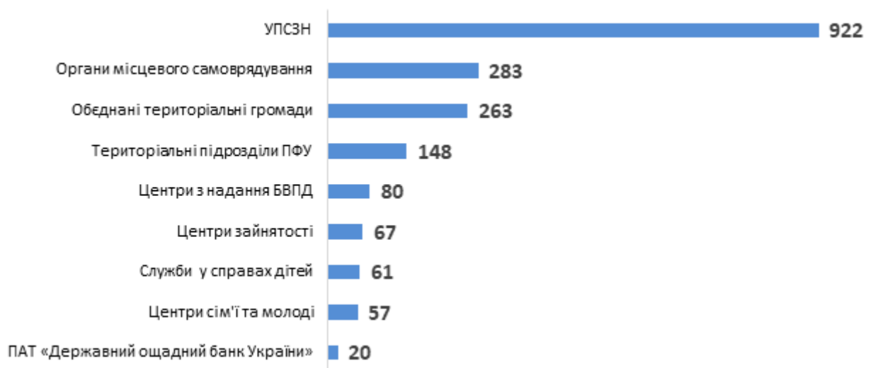
Діаграма 4. Розподіл консультацій для службовців за типами, кількість наданих радниками консультацій для службовців

Всього у своїх областях радники та радниці консультували представників 297 УПСЗН, що становить 45% від усіх управлінь в Україні.