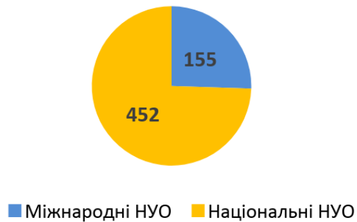
Діаграма 3. Розподіл консультацій для НУО за типом організацій, кількість наданих радниками консультацій для НУО

Серед консультацій для службовців найбільше консультацій було надано представникам УПСЗН (922 консультації) та представникам органів місцевого самоврядування (283 консультації) (див. Діаграму 4).