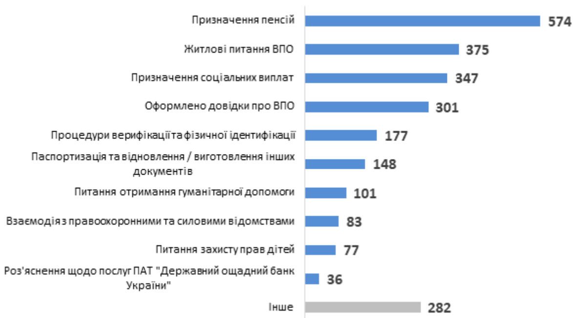
Діаграма 2. Розподіл консультацій за типами запитів, кількість наданих радниками консультацій

Серед проведених радниками консультацій для НУО більшість було надано представникам національних НУО (див. Діаграму 3).