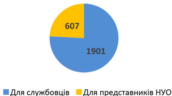
Діаграма 1. Розподіл консультацій за типом, кількість наданих радниками консультацій

Найбільше консультацій стосувалося питань призначення пенсій (574 звернення) та житлових питань (375 звернення) (див. Діаграму 2). У травні суттєво зросла кількість запитів до радників щодо пенсійних питань у зв'язку з призупиненням таких виплат для ВПО.