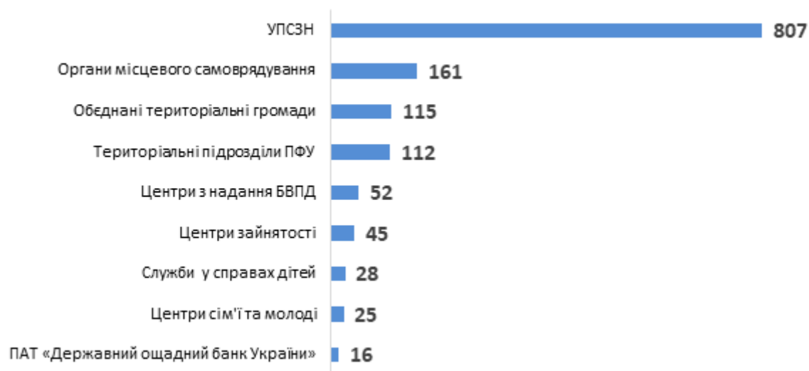
Діаграма 3. Розподіл консультацій для службовців за типами, кількість наданих радниками консультацій для службовців

Всього у своїх регіонах радники та радниці консультували представників 240 УПСЗН, що становить 36% від усіх управлінь в Україні.