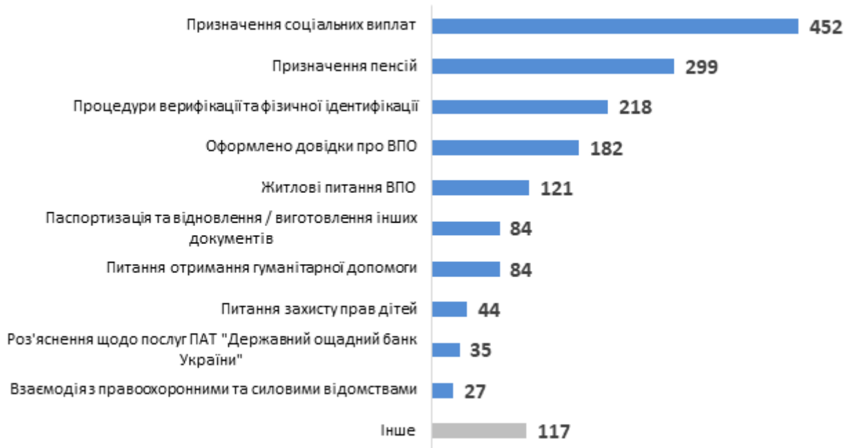
Діаграма 2. Розподіл консультацій за типами запитів, кількість наданих радниками консультацій

Серед консультацій для службовців найбільше було надано представникам УПСЗН (807 консультацій) та представникам органів місцевого самоврядування (161 консультації) (див. Діаграму 3).