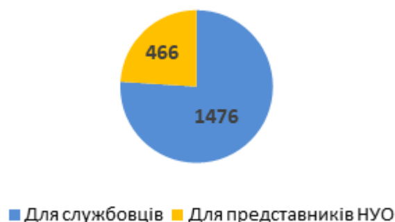
Діаграма 1. Розподіл консультацій за типом, кількість наданих радниками консультацій

У серпні 2018 р. радниками було надано 1 942 консультації для службовців та представників НУО. Службовцям за звітний період всього було надано 1 476 консультацій. А представникам неурядових організацій – 466 консультацій (див. Діаграму 1).