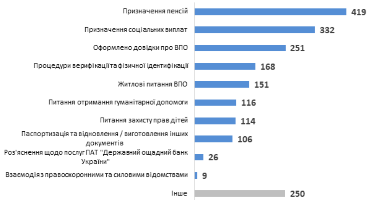
Діаграма 2. Розподіл консультацій за типами запитів, кількість наданих радниками консультацій

Серед консультацій для службовців найбільше було надано представникам УПСЗН (915 консультацій) та представникам органів місцевого самоврядування (130 консультацій) (див. Діаграму 3).