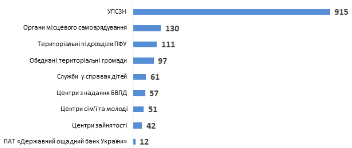
Діаграма 3. Розподіл консультацій для службовців за типами, кількість наданих радниками консультацій для службовців

Серед консультацій для службовців найбільше було надано представникам УПСЗН (915 консультацій) та представникам органів місцевого самоврядування (130 консультацій) (див. Діаграму 3).